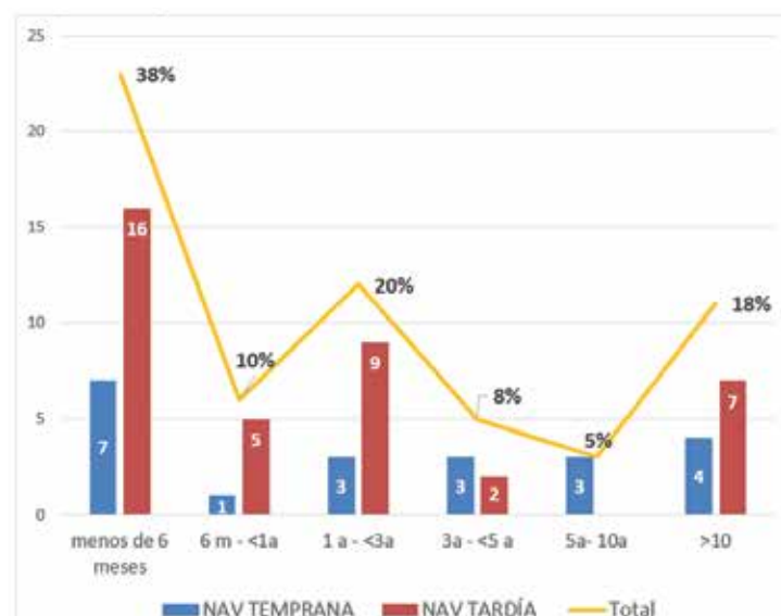
Figura 2. Frecuencia de la neumonía asociada a ventilador (NAV) y porcentaje según grupo etéreo en la unidad de cuidados intensivos pediátricos del Hospital Rebagliati 2015-2018.

2, frecuencia de NAV según grupo etéreo en relación con NAV temprana y Tardía y el porcentaje total según grupo etéreo, teniendo una mediana de edad de 15 meses (24 meses para NAV temprana y 10 meses para NAV tardía).